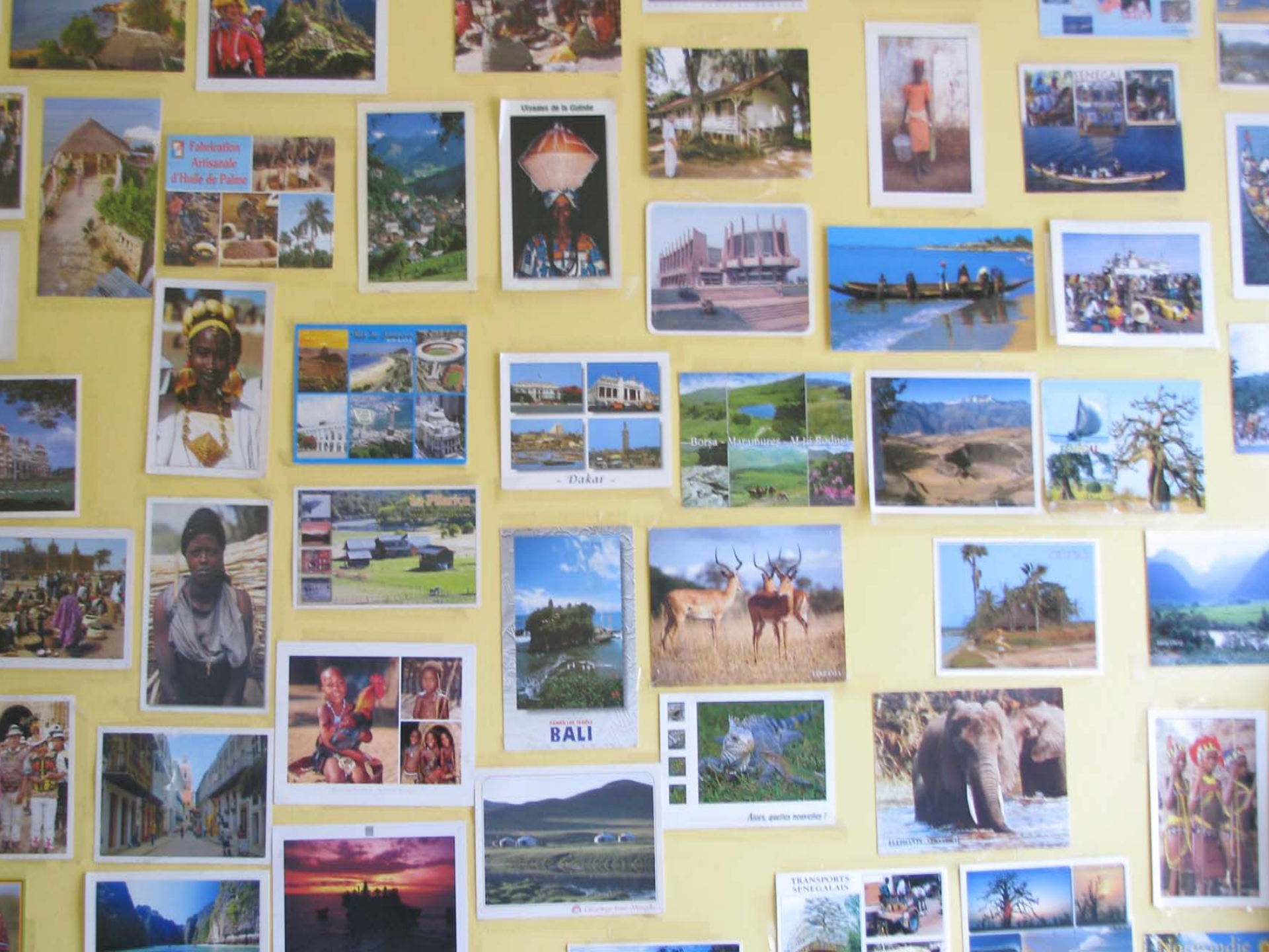
Fabrication Artisanale d'Huile de Palme