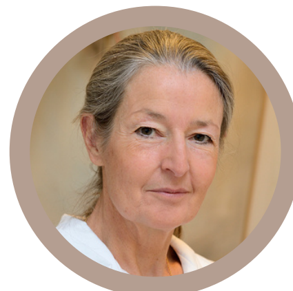
Pr Odile Launay Paris