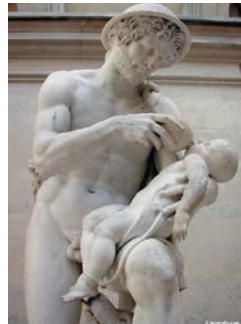
Œdipe enfant Musée du Louvre