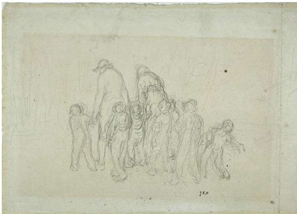
Jean-François Millet (1814-1875) le petit poucet amené à la forêt par ses parents