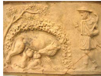
Rémus et Romulus Pergame Museum-Berlin