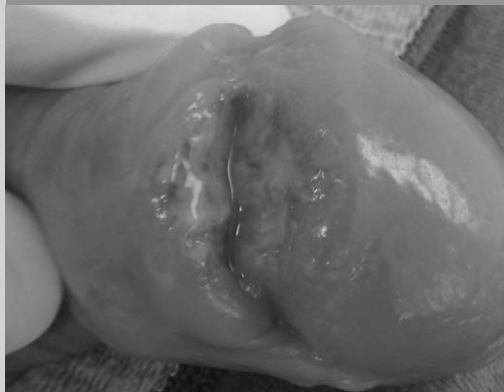
PUE6-158-2 : Chancre syphilitique du sillon balano-préputial