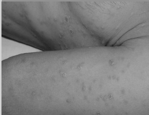
PUE6-158-3 : Syphilis secondaire (Roséole)