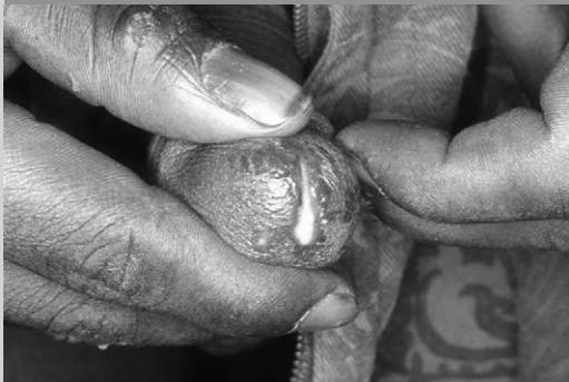
PUE6-158-1 : Ecoulement urétral